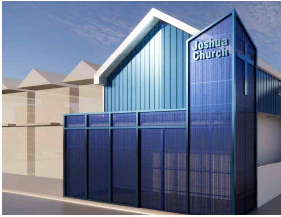
여호수아 교회 전체 조감도