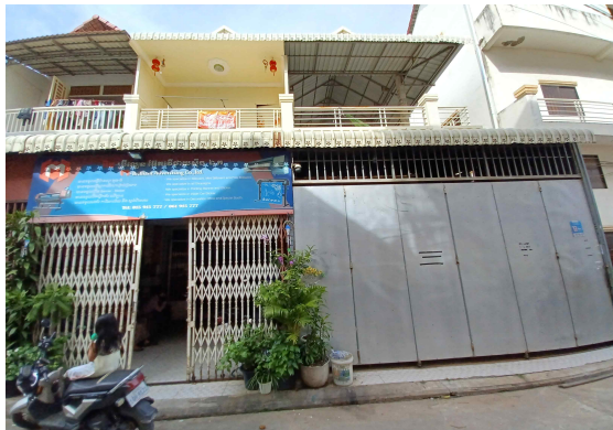
여호수아 교회 현재