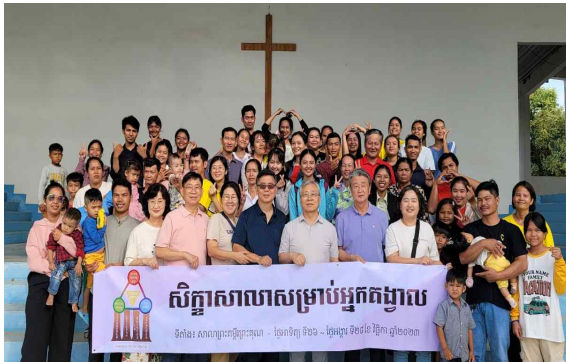
소그룹지도자 수련회(평신도를 지도자로)

캄보디아는 인구 1700만 가운데 프놈펜에 250만이 거주하고 있습니다. 프놈펜은 정치, 경제, 사회, 문화, 종교, 교육의 중심지로 장차 이 민족의 지도자가 될 사람들이 집중적으로 모여 살고 주변 위성도시까지 계속 확장되는 상태라 영혼구원과 제자를 세워 나가는데 있어 너무나 중요한 전략적 도시입니다. 캄보디아는 기독교 100년의 역사를 가지고 있지만 복음화율은 1프로에 가깝습니다. 즉 복음을 전하는 데는 최선을 다했지만 제자가 제자를 세워나가는 데는 부족한 모습이었습니다. 그렇지만 앞으로 여호수아 교회를 통해 캄보디아의 전역에 수많은 제자들이 일어나 이 땅을 하나님이 통치하는 하나님 나라의 모습으로 변화시킬 센터로서의 사명을 감당하기를 소망합니다.