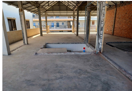
예배당이 들어설 옥상

하나님의 은혜로 연립주택 2채의 새로운 건물을 구입했습니다. 캄보디아 두 주인이 함께 팔아야 가능한 부분인데 저렴하게 구입할수 있어 감사를 드립니다. 연립주택 규격이 4미터 17미터이지만 끝에 있는 주택은 5미터 17미터라 연립주택 2채를 합치면 총 9미터 17미터 규모의 예배당을 지을 수 있습니다. 이제는 옥상의 모든 건물들을 철거해서 예배당을 지을 수 있도록 평평한 상태입니다.