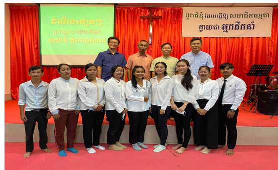
평신도 지도자 임명식