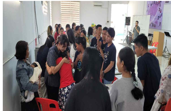
제자가 또다른 제자를 낳는다.